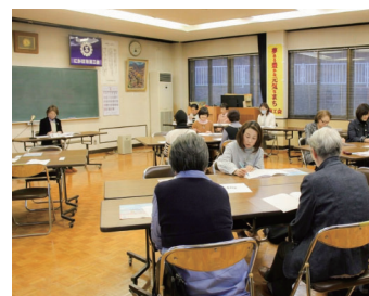
今年度の事業について熱心な議論を展開

また、通年事業の『愛の鈴』の作成や『にかほマルシェ』を通じて、地域共生への貢献に寄与する活動を展開していきます。