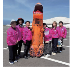
観光客をもてなす女性部員

4月17日（金）に象潟町本郷の麓から鳥海山五合目・鉾立へつながる県道「鳥海ブルーライン」の開通式が行われました。