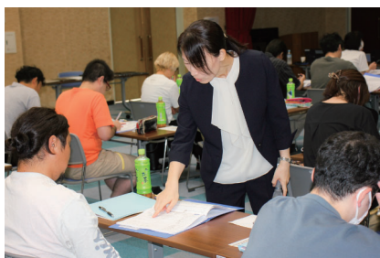
創業の実現に向けた計画書の作成を支援

「令和8年度にかほ創業塾」について、右記のとおり実施予定です。創業の心構えや持続可能な経営を学べる良い機会ですので、お知り合いで創業をお考えの方、創業して間もない事業者の方へ、ぜひ参加をお勧めください。