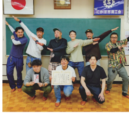
部員増強運動に積極的に取り組んだ青年部役員

5月1日（金）に開催された秋田県商工会青年部連合会通常総会にて、当会青年部の「令和7年度部員増強運動」の取組が評価され、優良取組部門最優秀賞を受賞しました。引き続き、各種事業を通じて青年部の存在感と認知度を高め、共に地域を盛り上げる仲間を増やしながら、地域経済の活性化に取り組んでまいります。