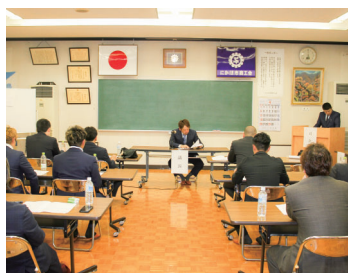
総会で活発な意見交換を行う青年部員

今年度は、市内で大型イベントの開催が予定されており、そうしたイベントへの出店等を通じて、地域の賑わい創出に全力で取り組みながら青年部の認知度を高めつつ、部員獲得に努めてまいります。また、研修事業等の開催と受講を通じて、経営者や後継者としての資質向上を図っていきます。