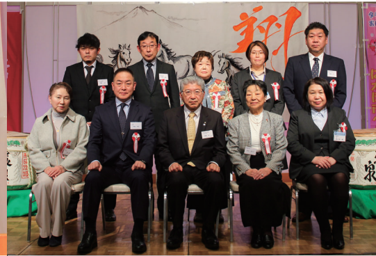
商工会法施行65周年記念表彰の受賞者