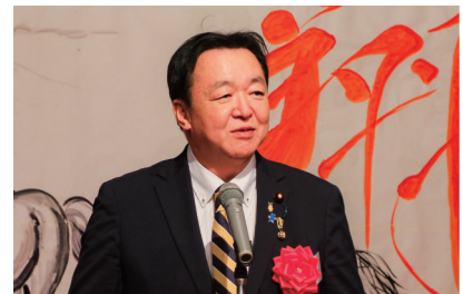
来賓祝辞 (村岡衆議院議員)