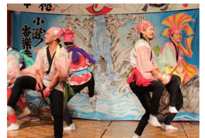
小滝舞楽保存会による「鳥海山小滝番楽舞」