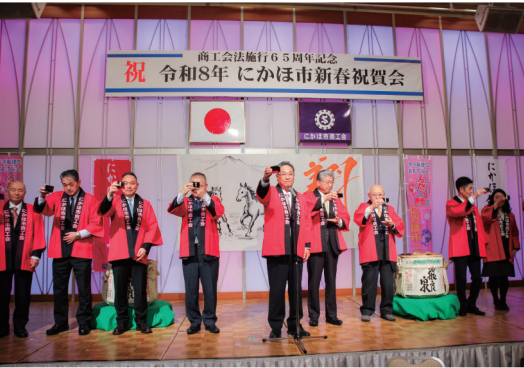
地域の発展を願い乾杯を行う宮崎議長

Nikaho City Society of Commerce and Industry