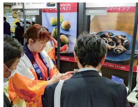
大規模展示商談会への出展を支援