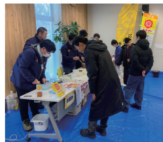
鱈しょつつるうどんを新発売

12月13日（土）、にかほ市イベント実行委員会や株式会社プレステージ・インターナショナルと連携し「にかほ冬フェスティバル with にかほマルシェ」を秋田BPOにかほキャンパスにて開催しました。当日は出前商店街振興会による商品販売や女性部による体験事業、青年部で新たに開発した「鱈しょつつるうどん」の販売を行い、来場者からは「多くの人で賑わっていて楽しかった。」「鱈しょつつるのお出汁が美味しかった。」と大変好評でした。