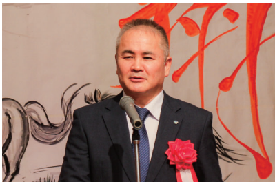
来賓祝辞 (市川市長)