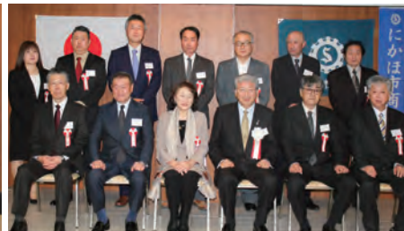
「令和7年度 会員の集い」にて受賞された皆さま