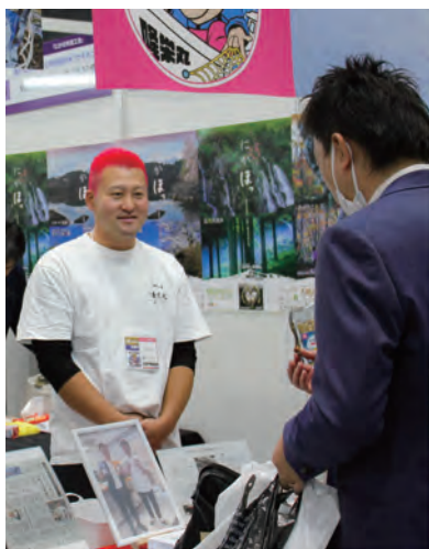
完成した新商品を商談会でPR

株式会社えっこは主に漁業と魚介類販売を営んでおり、令和7年からは新たに加工工場を新設し、自社で水揚げした水産物を加工する六次産業化に取り組んでいます。当会では、専門家とともに食品表示のアドバイスをいたしました。また、パッケージデザインの制作や魚の皮むき機の導入にあたり、秋田県の「食品産業価格高騰対策事業費補助金」の活用を支援したほか、新商品開発に向けた事業計画書の作成、融資実行などを支援し、今回の商談会への出展につながりました。今後も開発した商品の販路拡大に向けて、伴走支援を継続していきます。