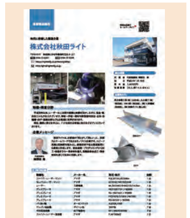
デジタルリーフレットの事例

来場者からは、「にかほ市の漁業に対する熱意が伝わった。」「他にはないお米への取組に興味があった。」といった声がありました。