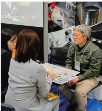
新たな取引先の獲得につながる商談会

新たな取組である「デジタルリーフレット」は、モニターに映し出すことで離れた場所からでも目に留まり、ブース前に人を立ち止まらせる効果を生み出しました。また、デジタルリーフレットには二次元コードを掲載しており、それぞれの来場者のスマートフォン等からダウンロードし、企業情報を一目で閲覧できる仕組みです。ダウンロードして持ち帰ることができるため、来場者からは「社内で情報を共有しやすい。」「荷物にならず、後からじっくりと内容を確認できる。」といった声が寄せられ、大変好評でした。