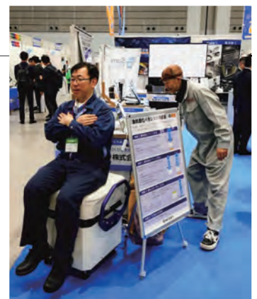
商談会で新製品の体験会を実施

大学や関係機関と連携し長年開発していた製品が完成しました。新製品完成後、複数のバイヤーに実際に体験してもらおう機会がなかったので、今回の商談会で取引相手の生の声を聞くことができたのは大きな収穫でした。手ごたえのある商談もでき、今後の成果につながると期待しています。