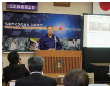
共同出展の取組を伝える記者会見

複数の新聞社に掲載されるなど高い関心を集め、ホームページやSNSとの相乗効果で県内外に広く周知することができました。会見当日は、それぞれの事業者が自社の取組をまとめ、特徴や強みを端的に伝える場になっており、商談のシミュレーションとしても役立ち、参加者からは「良い予行演習になった。万全の体制で商談会に臨むことができた。」との声をいただきました。