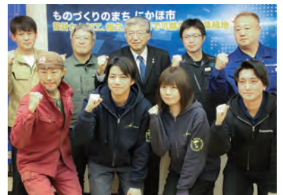
共同出展に臨む電子部品等製造業者